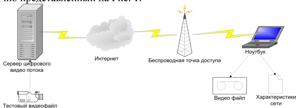
Рисунок 1 Схема проведения экспериментов

модели на случай беспроводных сетей разработан план эксперимента, схематично представленный на Рис. 1.